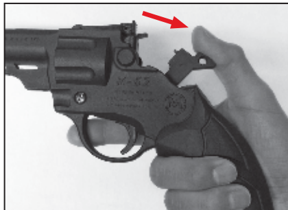
1. Accionar el Martillo hacia atrás al máximo.

UTILICE ÚNICAMENTE DIÁBOLOS 2000 EXPRESS CAL: 4.5 mm. Y CUALQUIER CARTUCHO DE SALVA.