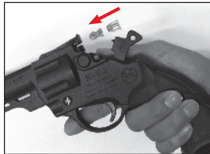
3. Colocar diábolos 2000 Express de plomo y cartuchos de salva en la recámara. Siempre apuntando hacia el piso.