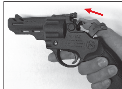
4. Cerrar el Estribo.