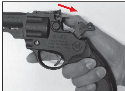
2. Abrir el Estribo.